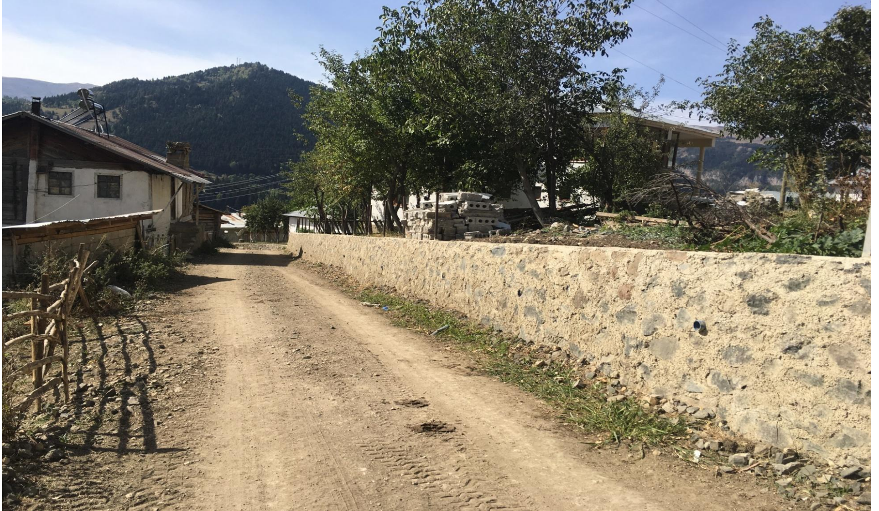
ARDANUÇ GÜLEŞ KÖYÜ TAŞDUVAR YAPIMI 2.580 M 3