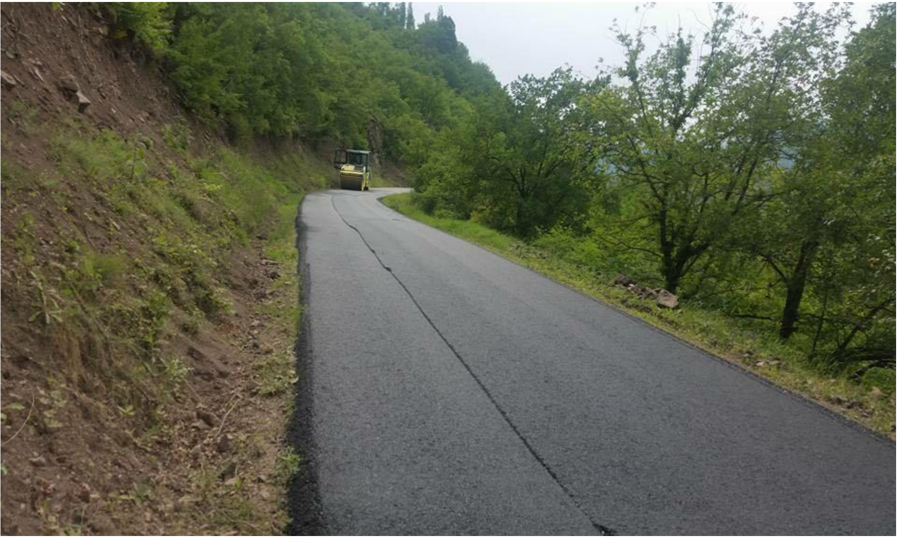
ÖRTÜLÜ-MEŞEKÖY-OVACIK KÖYLERİ GRUP YOLU ASFALT YOL YAPIMI 0,56 KM