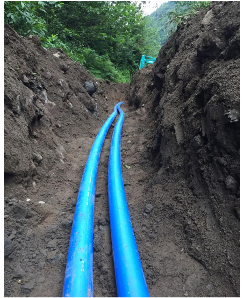
BORÇKA KARŞIKÖY KÖYÜ İÇME SUYU PROJESİ NÜFUS : 678 KİŞİ