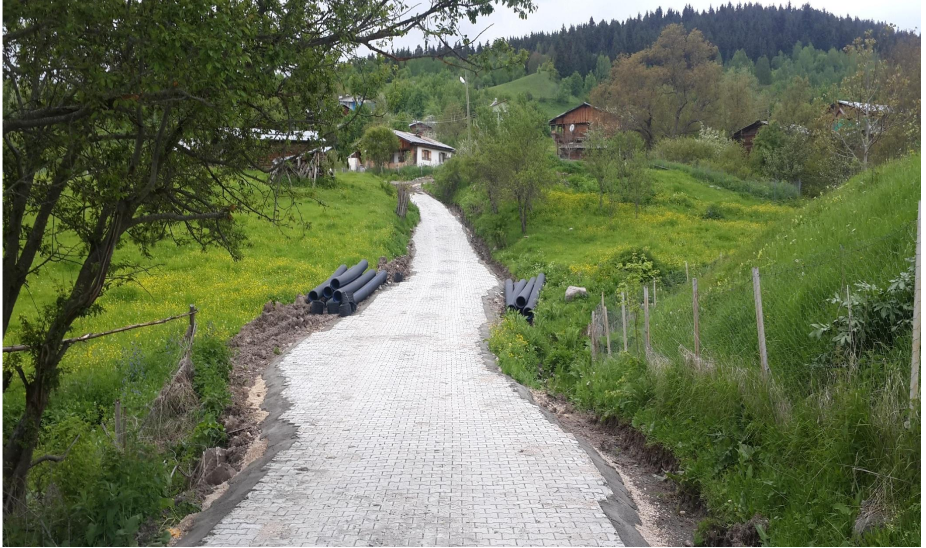
ŞAVŞAT MEŞELİ KÖYÜ PARKE YOL YAPIMI 6.675 M 2