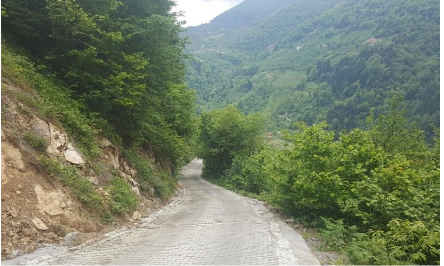
BORÇKA CAMİLİ KÖYÜ PARKE YOL YAPIMI 2.000 M 2