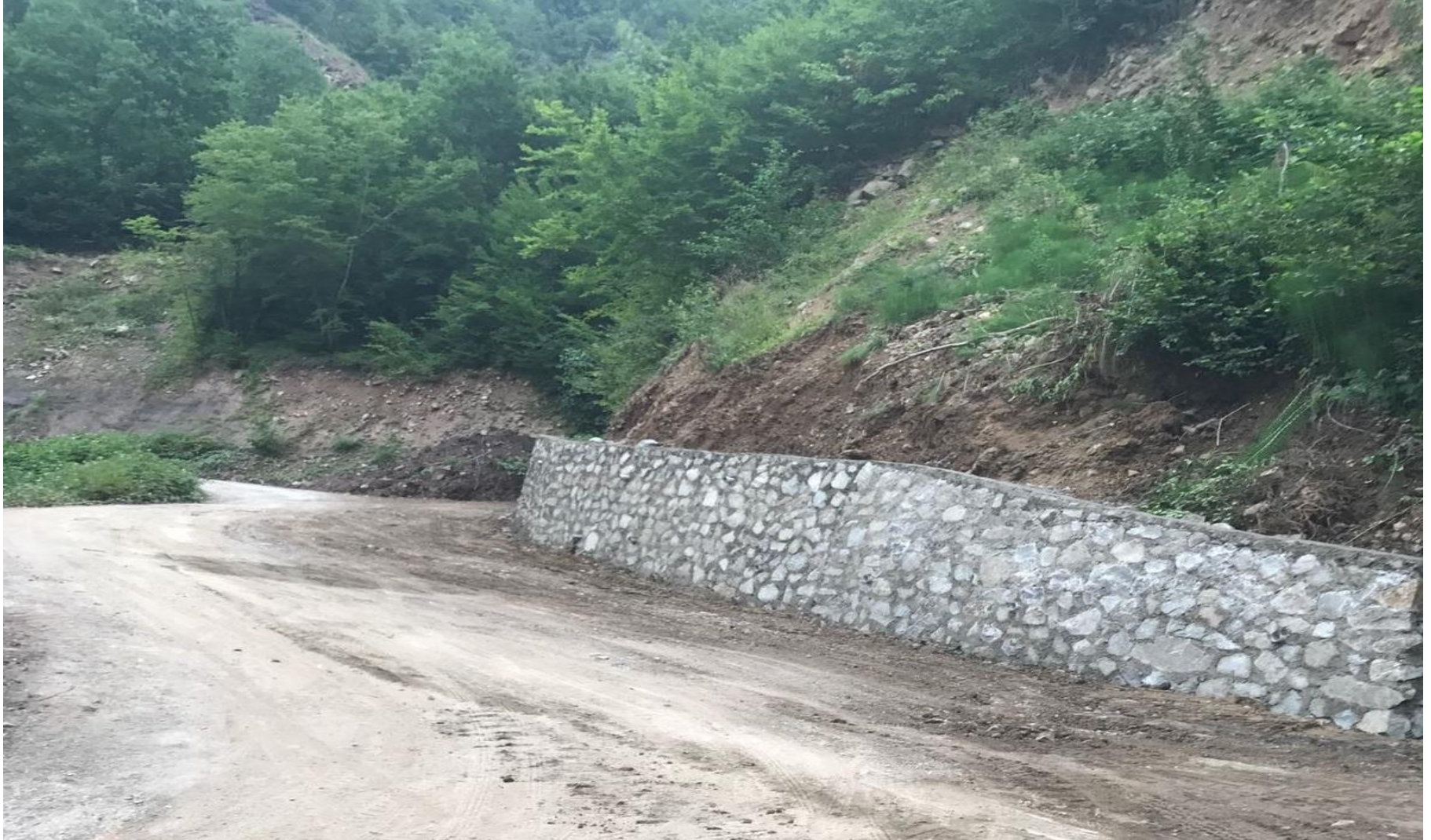
MURGUL KORUCULAR KÖYÜ TAŞ DUVAR YAPIMI 301 M 3