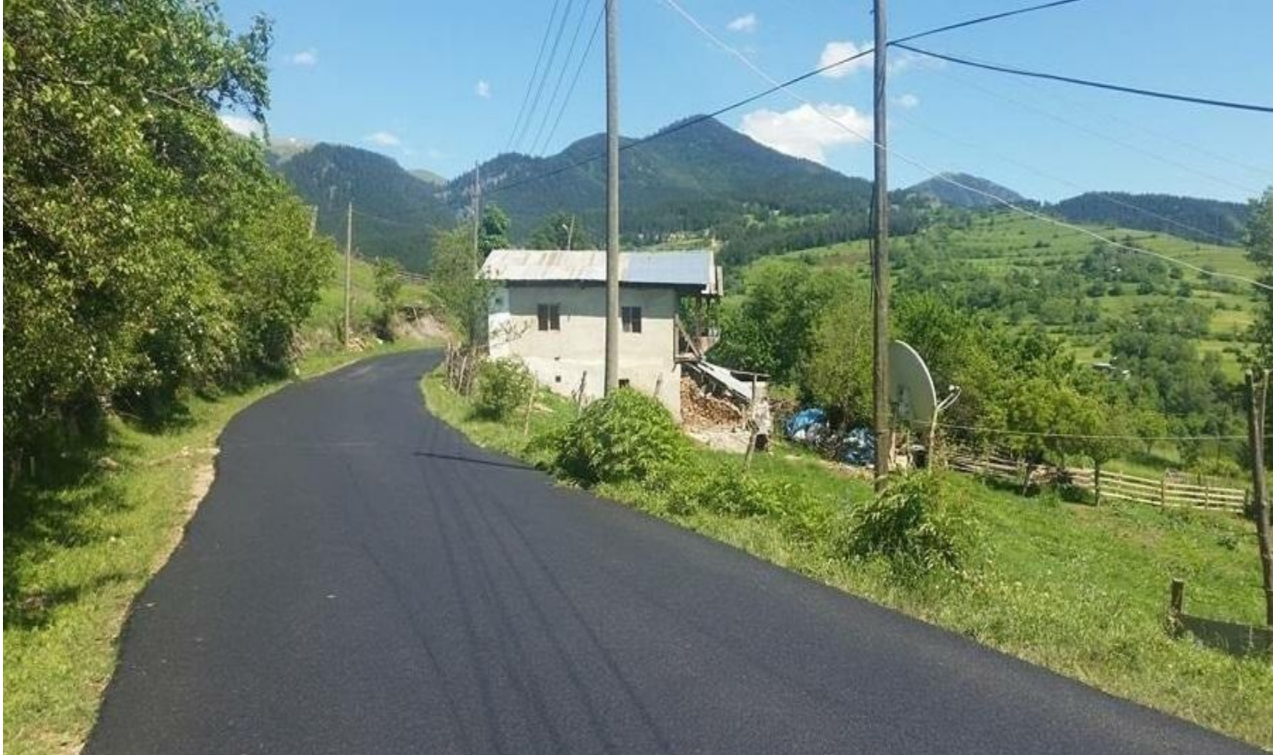
ARDANUÇ AKARSU-KONAKLAR ASFALT YOL YAPIMI 1,9 KM