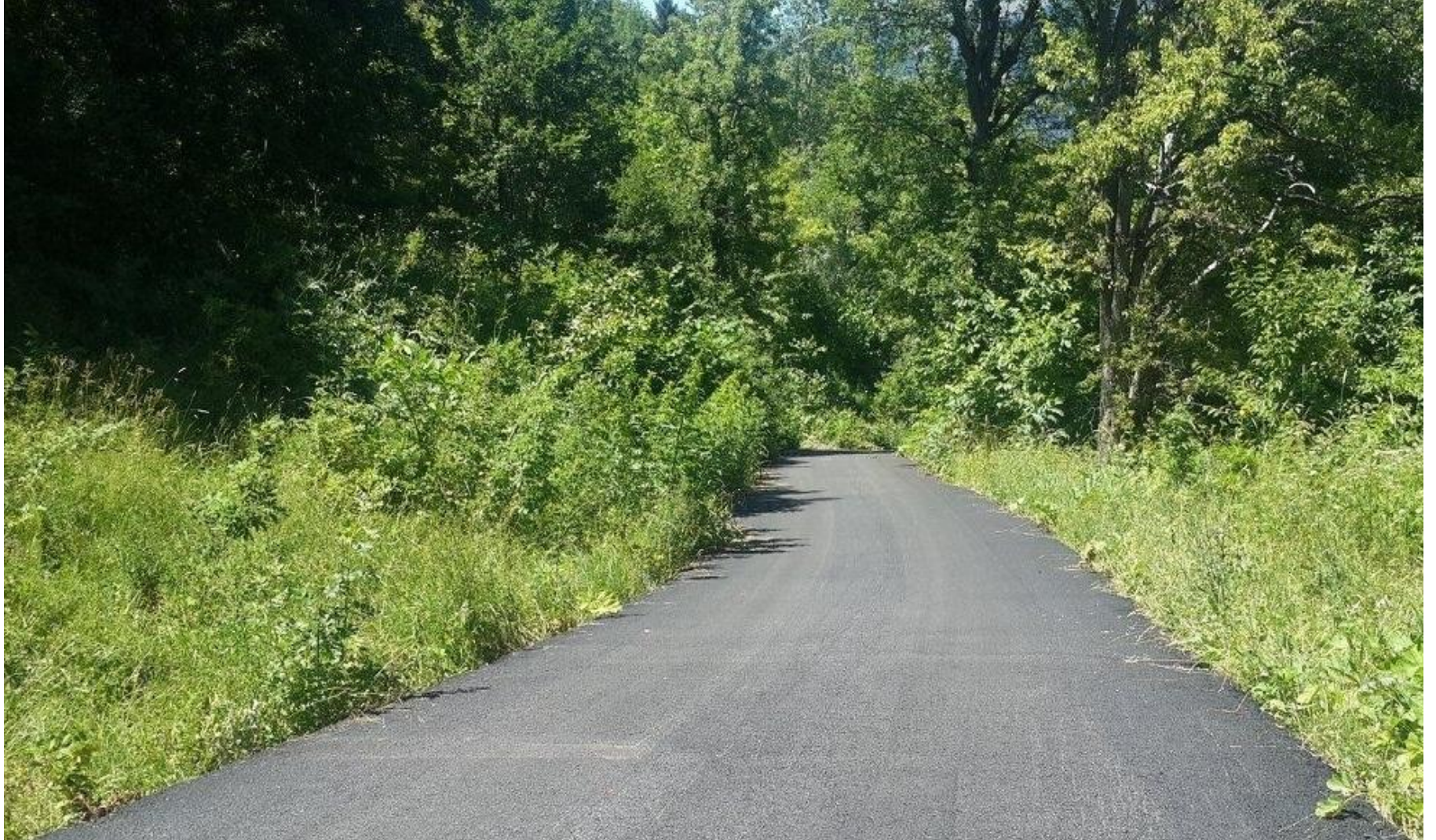
ŞAVŞAT MEYDANCIK KÖYÜ ASFALT YOL YAPIMI 1,50 KM