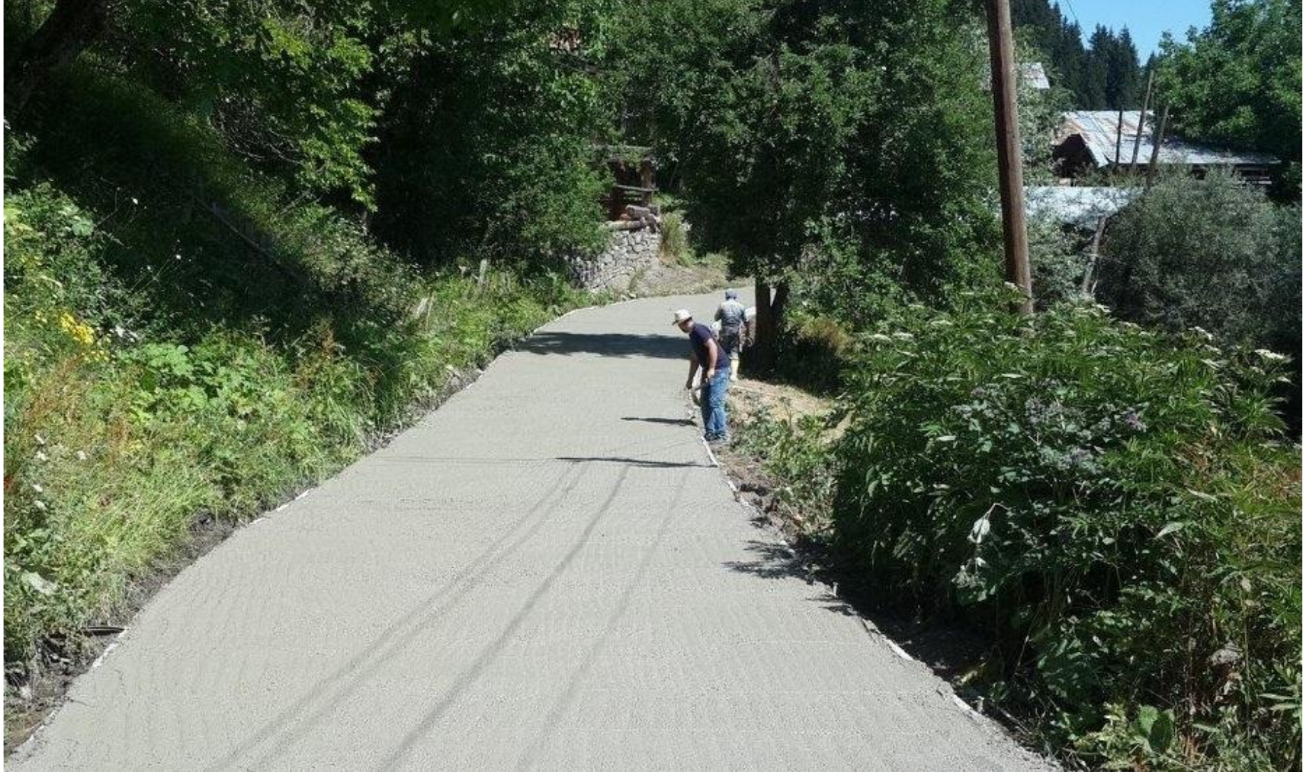
ŞAVŞAT ÇAĞLAYAN KÖYÜ BETON YOL YAPIMI 0,20 KM