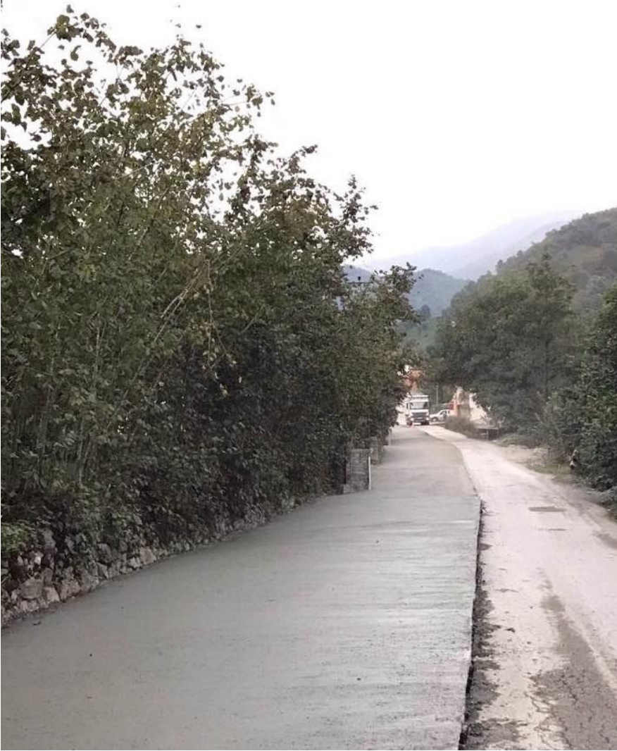
ARHAVİ KONAKLI-ŞENKÖY GRUP BETON YOL YAPIMI (1,15 KM)