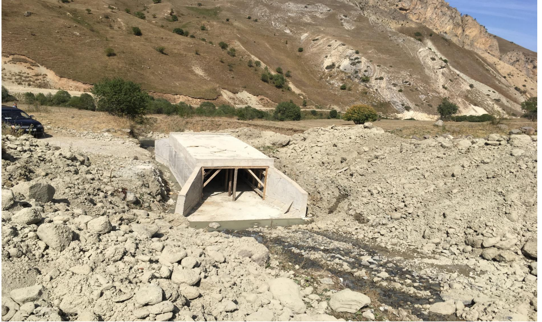
ARDANUÇ ZEKERYA KÖYÜ MENFEZ YAPIMI