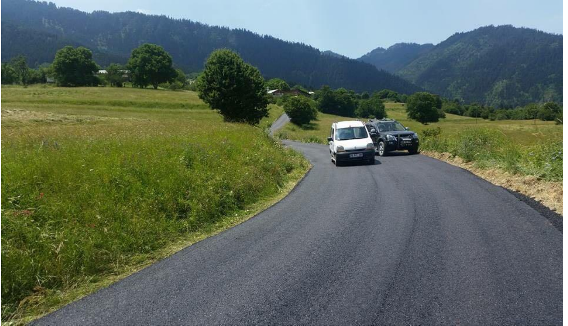
ARDANUÇ TOSUNLU KÖYÜ ASFALT YOL YAPIMI 0,56 KM.