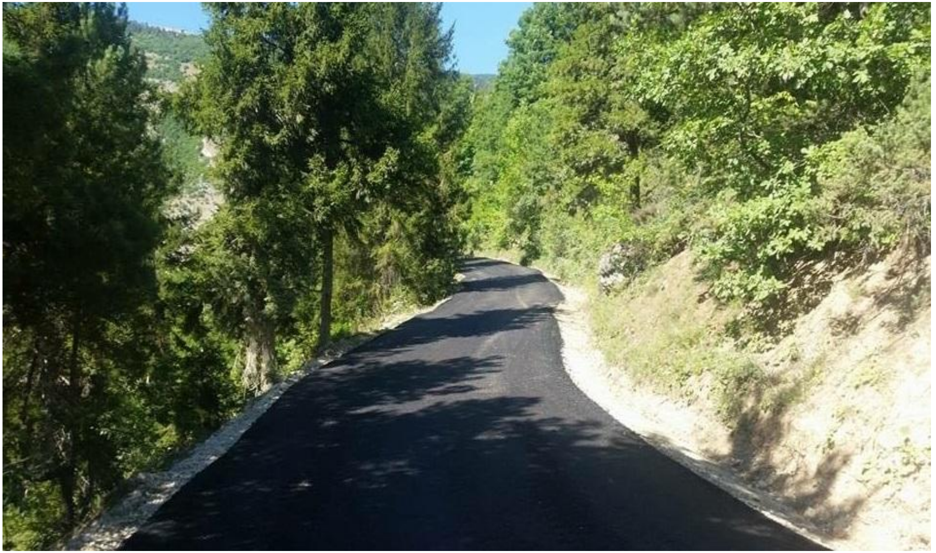
ARDANUÇ BERATLI-HAMURLU KÖYLERİ ASFALT YOL YAPIMI 0,56 KM