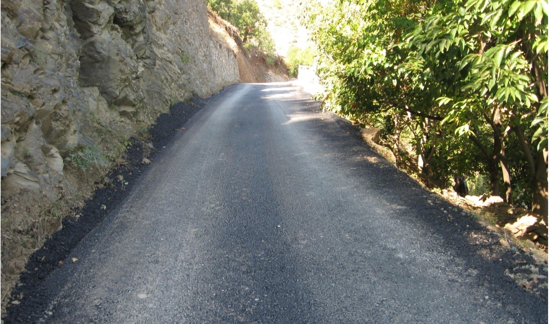
MERKEZ SAKALAR KÖYÜ ASFALT YOL YAPIMI 0,70 KM