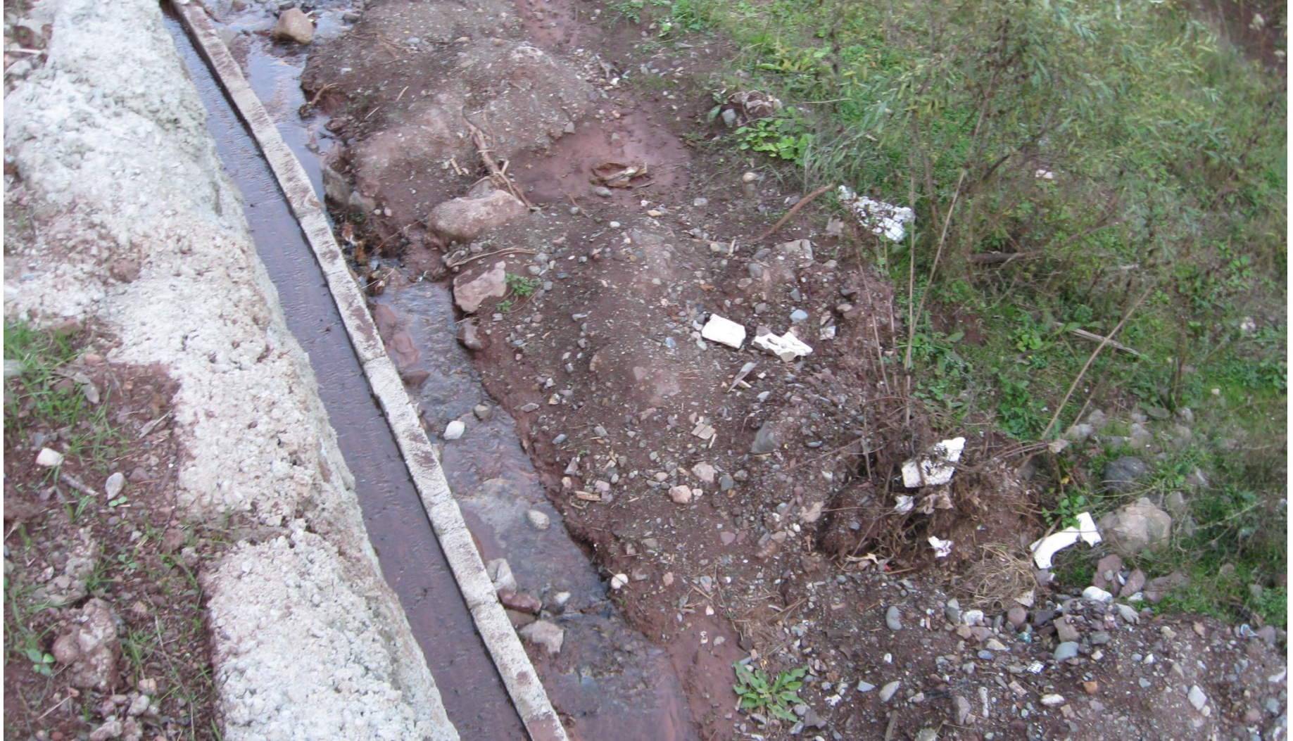
MERKEZ AŞAĞIMADEN KÖYÜ SULAMA KANALI YAPIMI