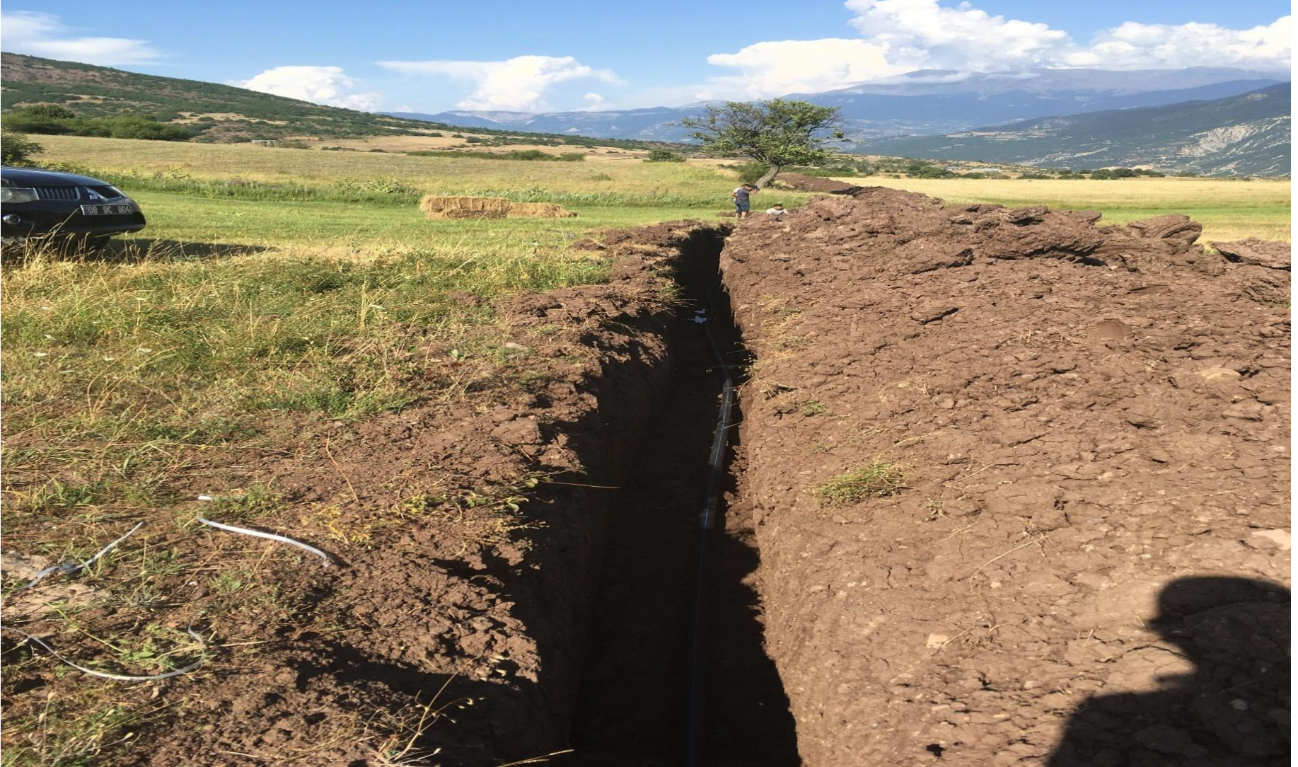
ARDANUÇ BEREKET KÖYÜ İÇME SUYU YAPIMI NÜFUS : 50 KİŞİ