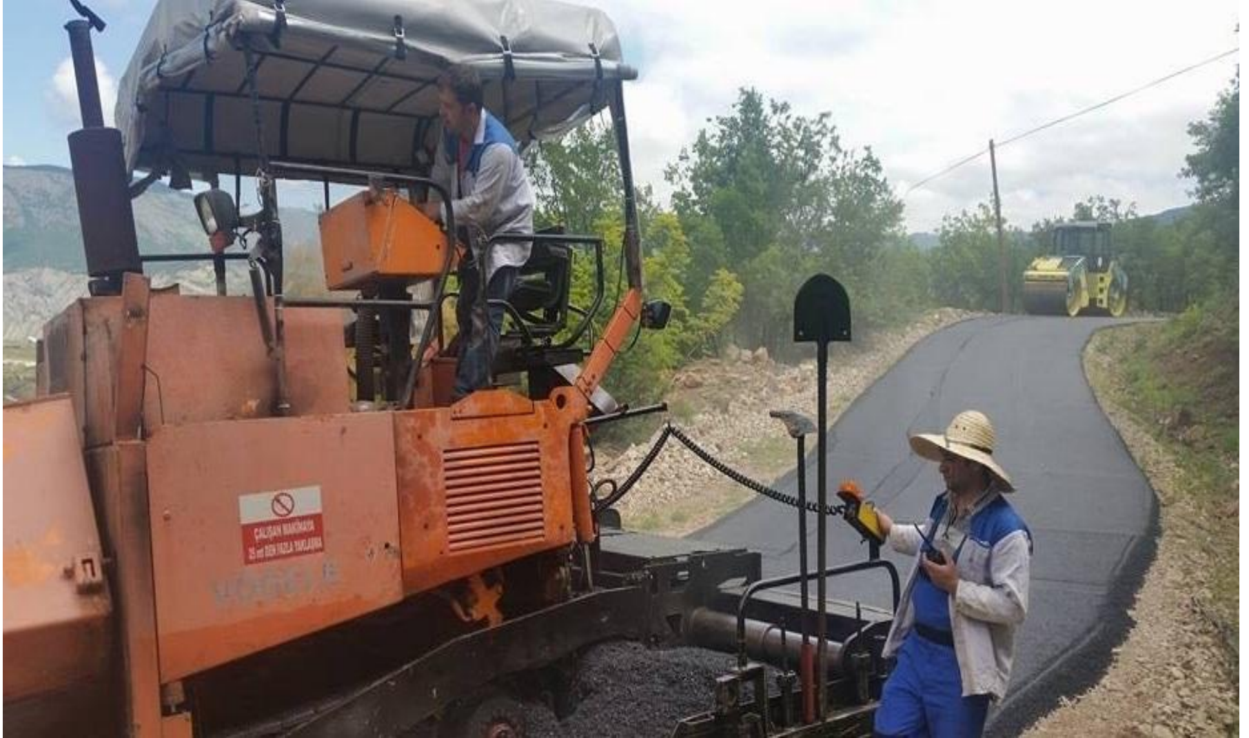
ARDANUÇ TEPEDÜZÜ-ÇIRALI KÖYLERİ ASFALT YOL YAPIMI 0,56 KM