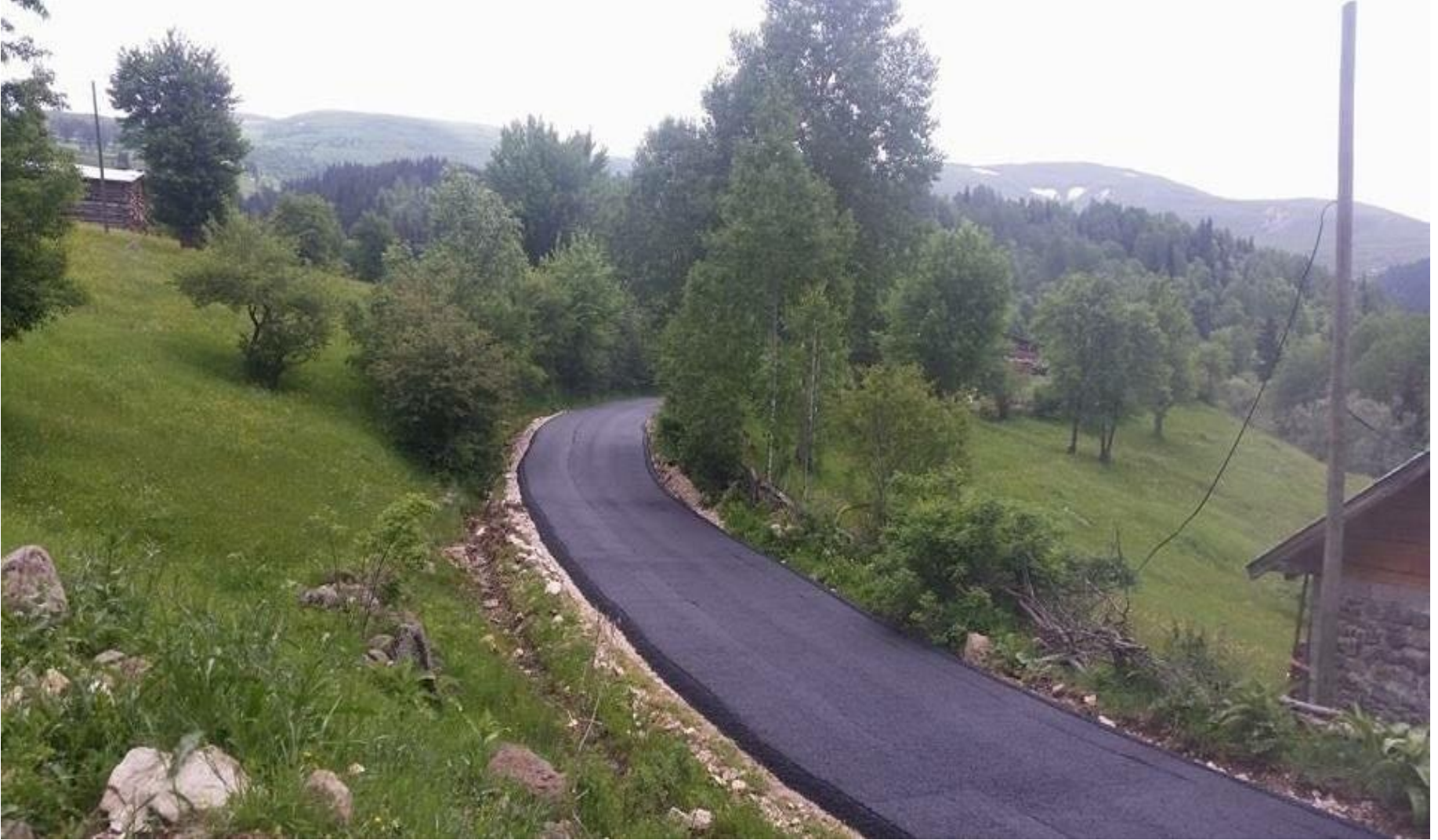
ARDANUÇ GÜLEŞ KÖYÜ ASFALT YOL YAPIMI 0,56 KM