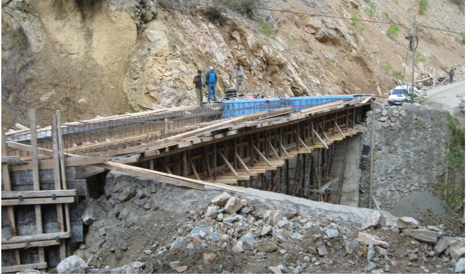
MERKEZ SARIBUDAK KÖYÜ KÖPRÜ YAPIMI