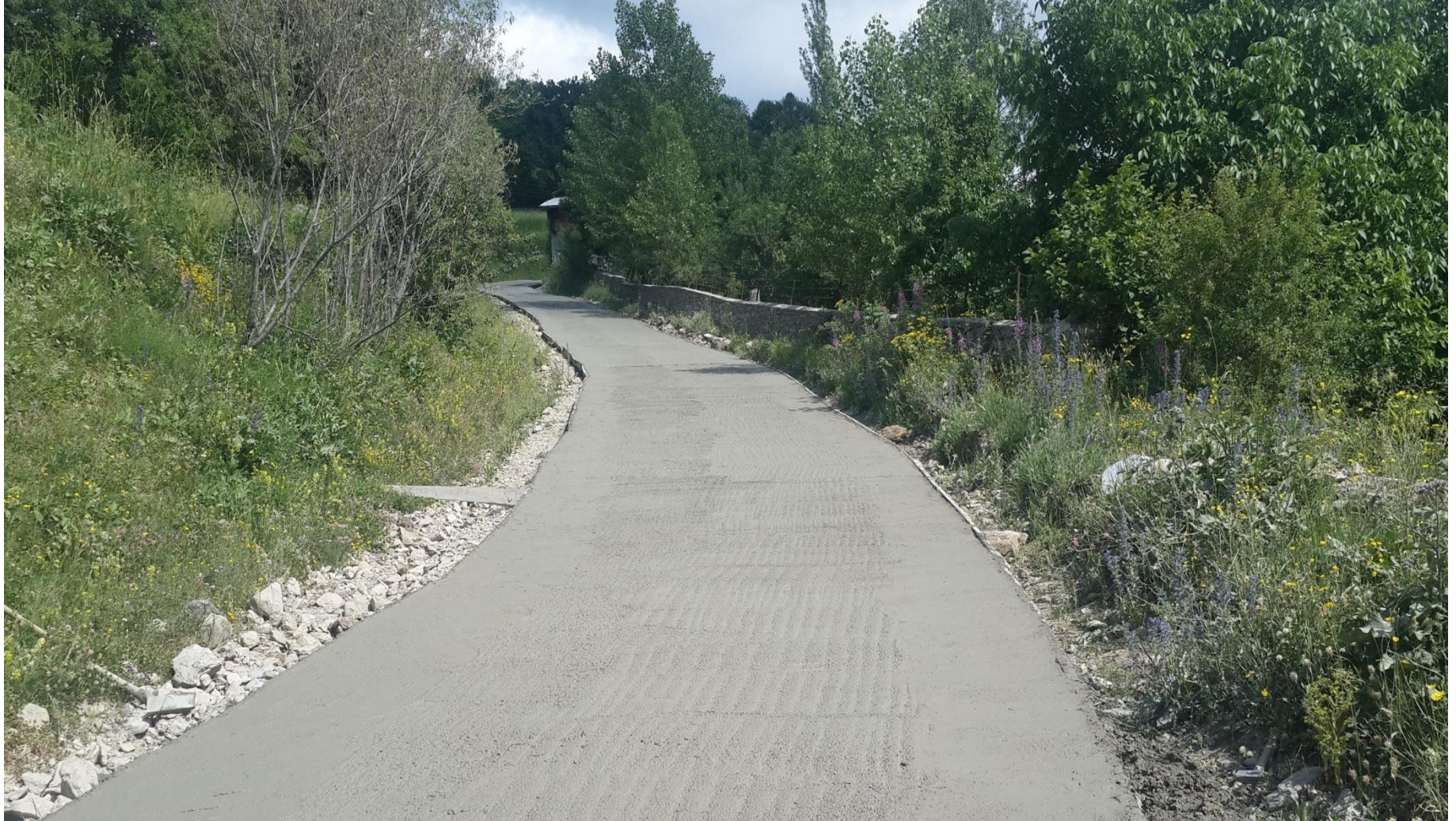
ŞAVŞAT PINARLI KÖYÜ BETON YOL YAPIMI 0,30 KM