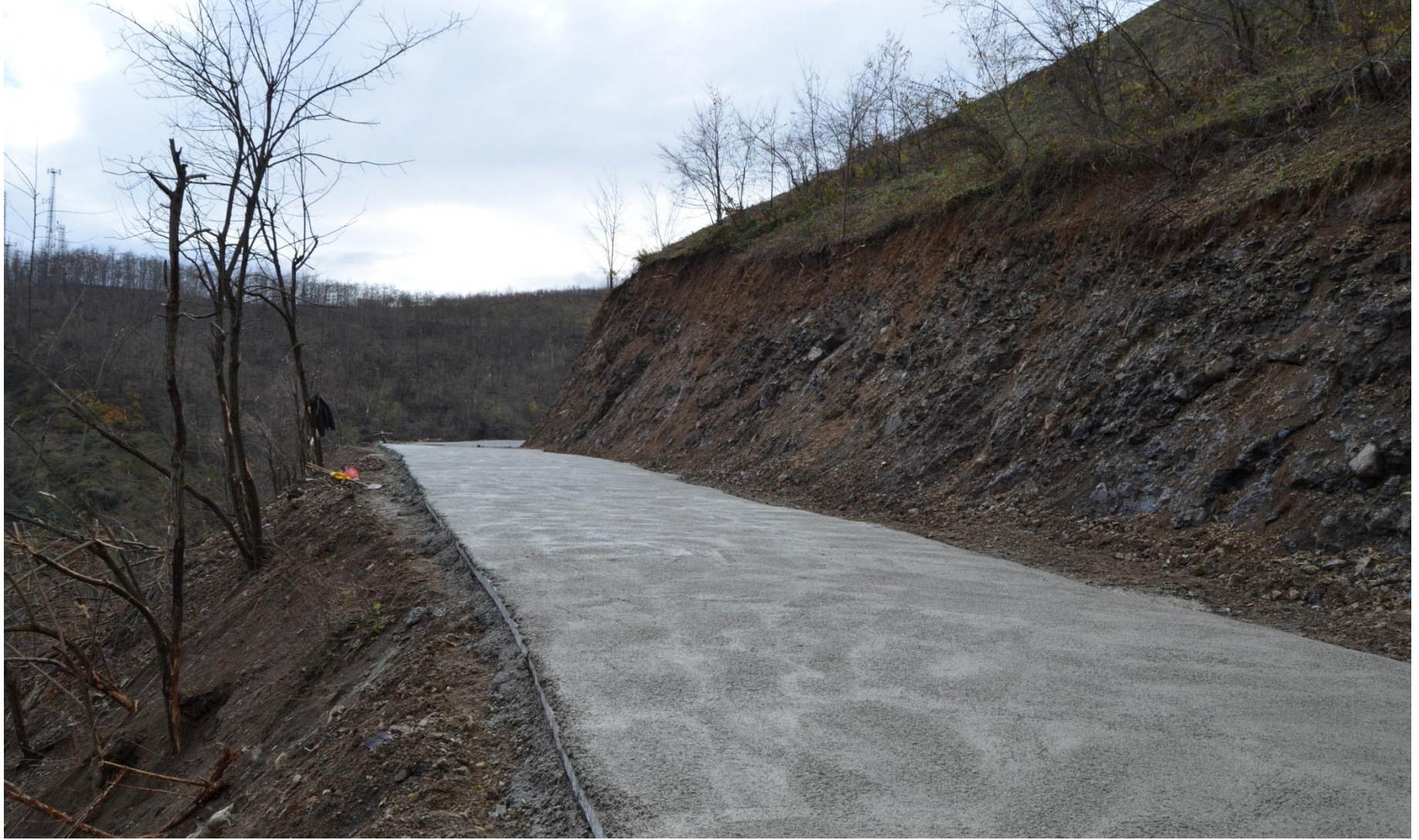
MURGUL PETEK KÖYÜ BETON YOL YAPIMI 0,23 KM