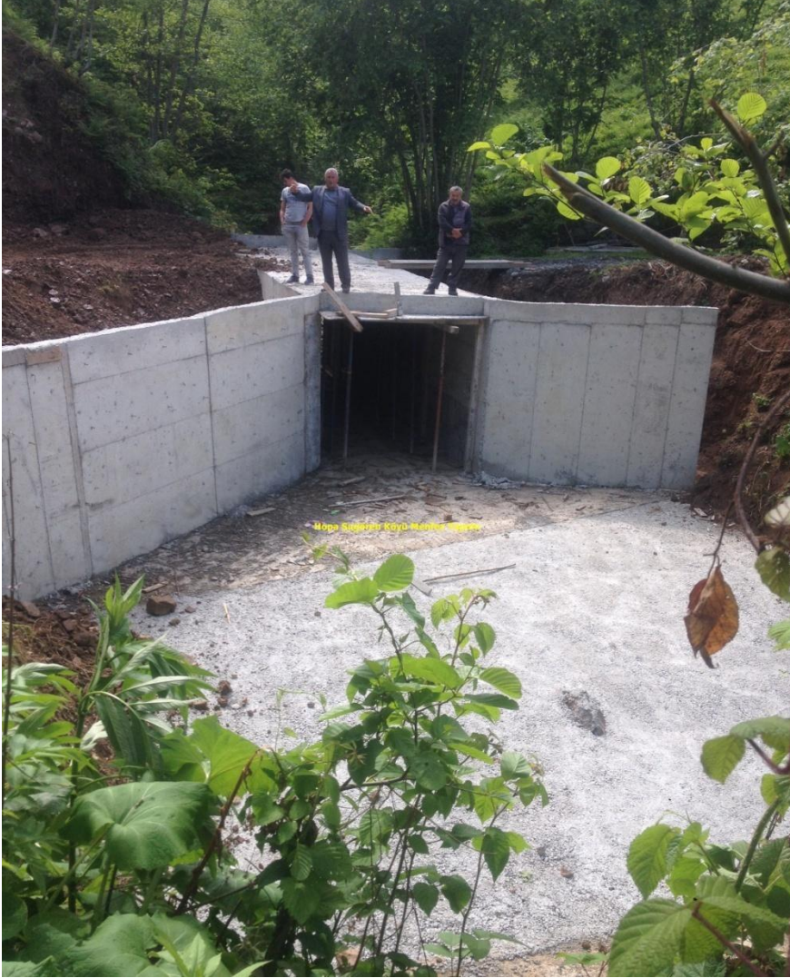
HOPA SUGÖREN KÖYÜ MENFEZ YAPIMI