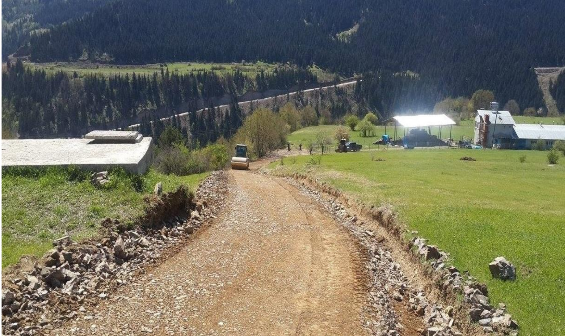
ŞAVŞAT KURUDERE STABİLİZE YOL YAPIMI 1 KM