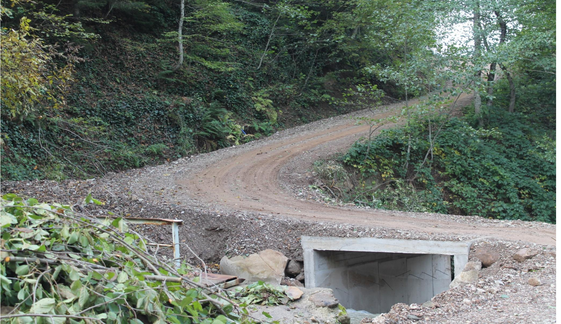
MERKEZ BEŞAĞIL KÖYÜ MENFEZ YAPIMI