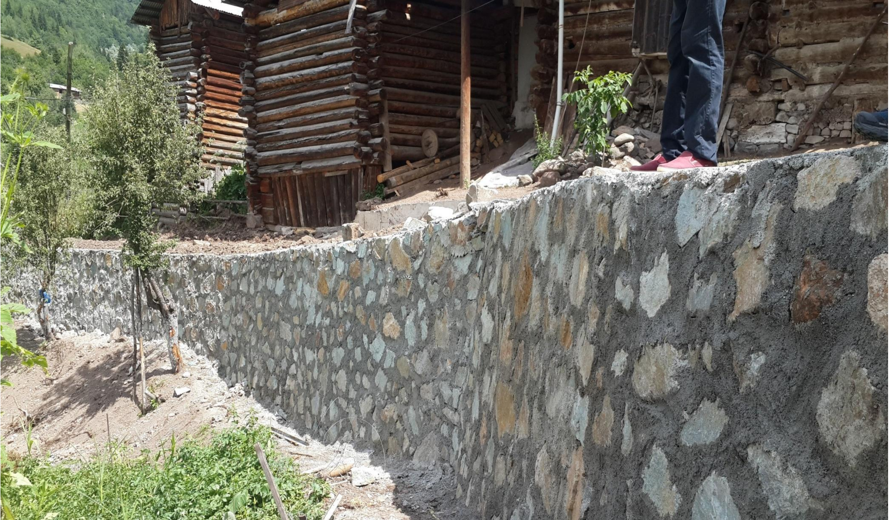
ŞAVŞAT KIRAZLI KÖYÜ TAŞDUVAR YAPIMI 120 M 3