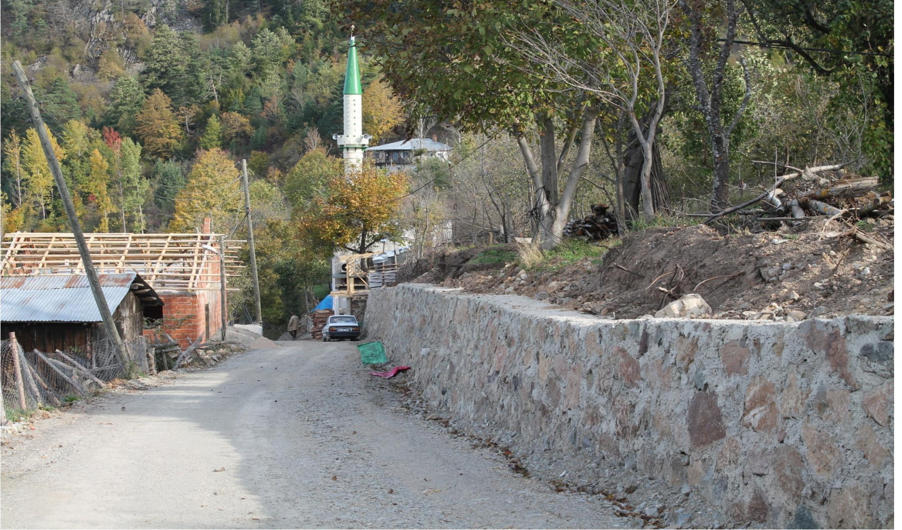
MERKEZ SÜMBÜLLÜ KÖYÜ TAŞ DUVAR YAPIMI 472 M 3