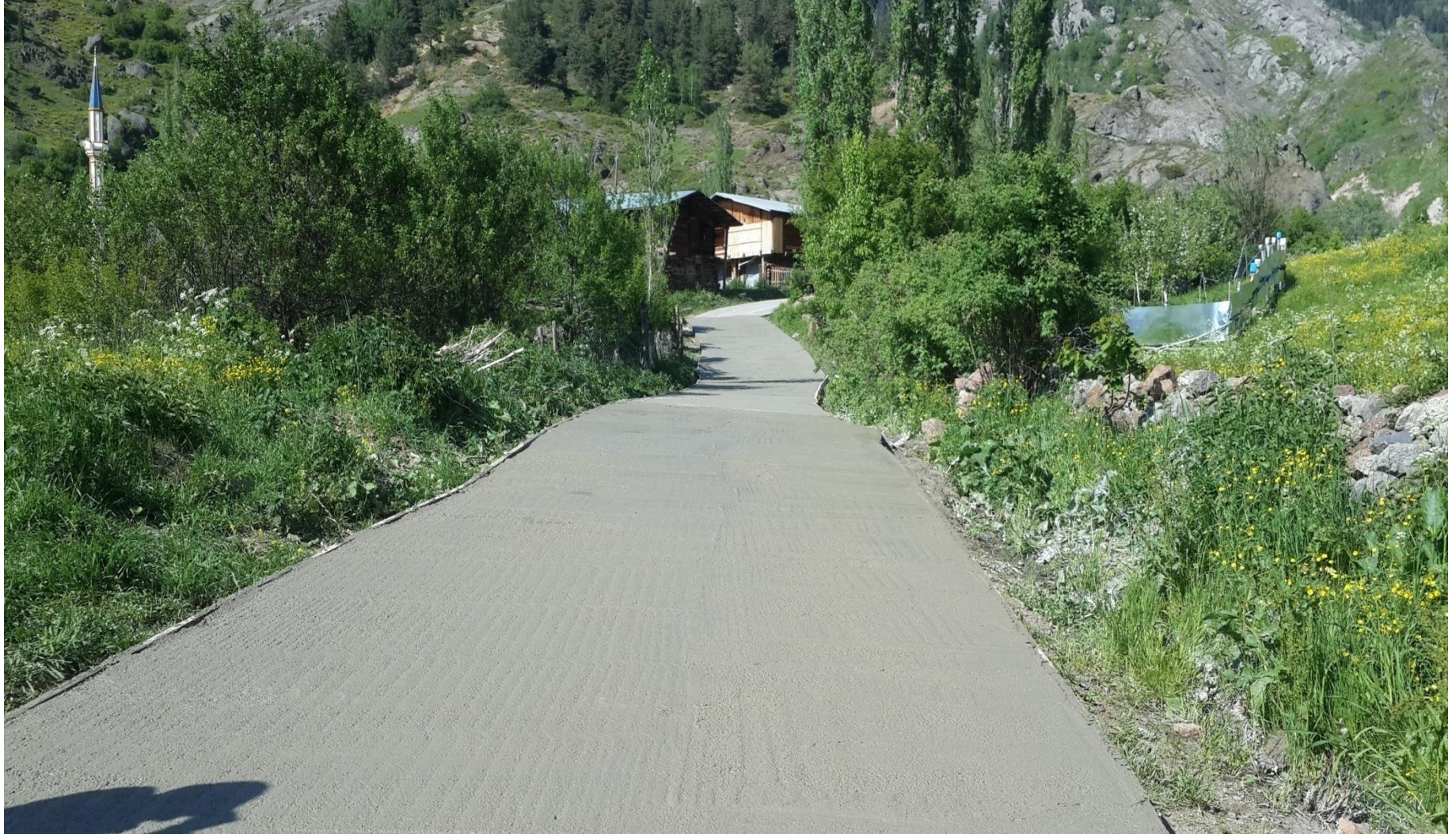
ŞAVŞAT DEMİRKAPI KÖYÜ BETON YOL YAPIMI 0,45 KM