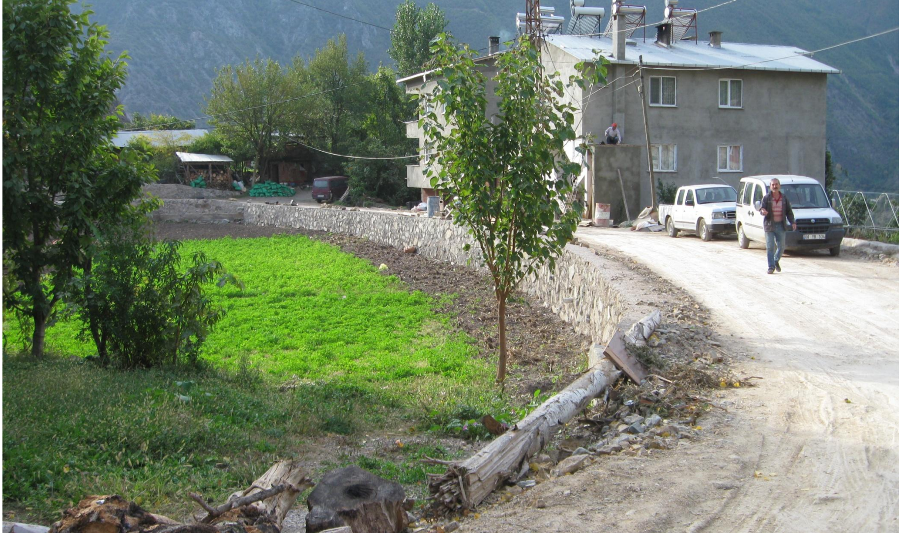
MERKEZ SEYİTLER KÖYÜ TAŞ DUVAR YAPIMI 905 M 3